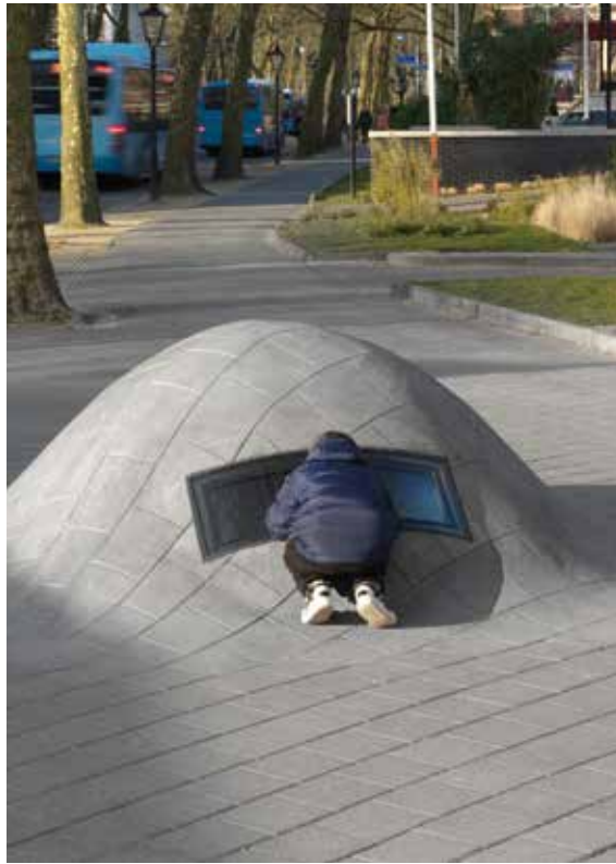
Ram Katzir en Hertog Nadler, Swol, 2014

Je kunt natuurlijk de bordjes 'Centrum' volgen, maar een kunstroute van het station naar het stadshart is spannender, vond de gemeente Zwolle, en deed een oproep. Meer dan honderd kunstenaars reageerden. De winnaars werden kunstenaar Ram Katzir samen met kunstenaarsduo Hertog Nadler. Zij bedachten 'Portal': een route en ook een tijdreis. Een blauwe bronzen lijn leidt bezoekers vanuit het station langs kunstwerken die iets vertellen over de cultuur en geschiedenis van Zwolle. De reis begint in de stations-tunnel waar op een groot videoscherm beelden zijn te zien die in het station zijn opgenomen: er loopt een schaapherder voorbij, er komen ridders van een roltrap, gevolgd door mensen op Hooverboards. "Die bestaan niet", zegt een jong meisje dat met haar vader staat te kijken. Die bestaan nóg niet, inderdaad. De melkkar die voorbijrijdt bestaat juist niet meer. En Herman Brood, geboren Zwollenaar, die even in beeld komt, is al geschiedenis. Ook in de andere kunstwerken lopen heden, verleden en toekomst door elkaar. De makers willen met de film het publiek meer betrekken bij de historie van de stad en tegelijkertijd je bewustzijn van ruimte en tijd prikkelen. Alle werken zijn te zien op de website portalzwolle.nl , maar het is veel leuker om hiervoor de trein naar Zwolle te nemen.