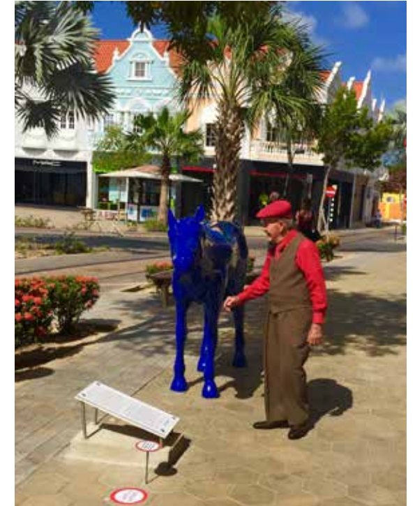
Osaira Muyale, Playa Caballos (Paardenbaai), 2014

Kunstenaar Osaira Muyale maakte op Aruba de installatie ‘Playa Caballos’ (‘Paardenbaai’) die een eerbetoon is aan de plek waar in de 17e eeuw Aruba en Nederland in paarden handelden. Het werk bestaat uit een route van acht paardsculpturen die begint op het strand waar de paarden werden aangevoerd, en leidt naar het historische centrum van Oranjestad. “De sculpturen hebben allemaal eenzelfde blauwe huid maar verschillende persoonlijkheden”, aldus Muyale, die vaker paarden laat terugkomen in haar werk. “Een paard is veruit een van de grootste bijdragen aan de verhoging van een beschaving”, is haar overtuiging. De lokale overheid en de particuliere stichting Fundación Eterno sloegen de handen ineen om deze opdracht te geven. Het belangrijkste doel van de stichting is om de lokale hedendaagse kunst nationaal en internationaal zichtbaar te maken en culturele uitwisselingen te stimuleren.