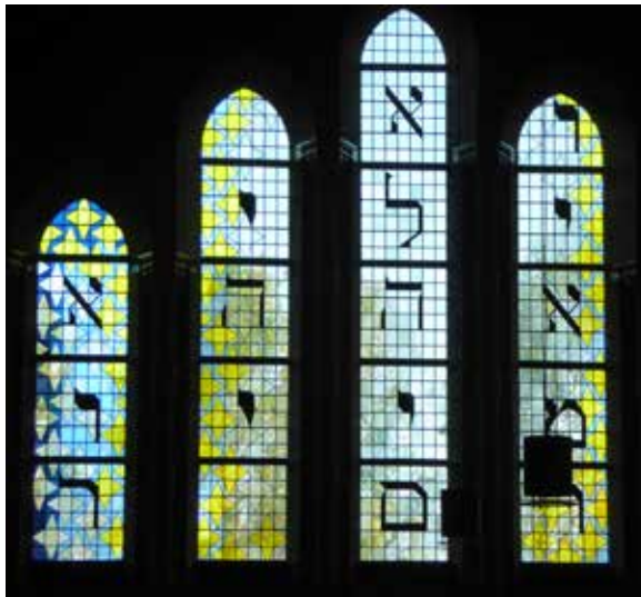
Jan Dibbets, Glas-in-lood ramen, 2014

Kunstenaar Jan Dibbets kreeg de opdracht om zestien nieuwe glas-in-loodramen te ontwerpen voor de Haarlemse basiliek Sint Bavo. Vanaf de oplevering van de kerk in 1898, door architect Pierre Cuypers, tot aan 1959 zijn er wel gebrandschilderde ramen geplaatst, maar door geldgebrek is dat niet bij het middenschip gebeurd. Nu er een grootscheepse restauratie aan de gang is wil de kerk dat alsnog. Het nieuwe ontwerp sluit aan bij de architectuur en de andere kunstvoorwerpen in de kerk, en verwijst naar bekende elementen uit het Rooms-Katholicisme en andere godsdiensten. Zo verwerkte Dibbets de vorm van een Latijns kruis, een Grieks kruis, een Patriarchenkruis en een Russisch-Orthodox kruis. Met een Hebreeuwse tekst verwijst hij naar het wrege lot van de Haarlemse joden die in de Tweede Wereldoorlog nabij de Sint Bavo werden samengebracht, alvorens op transport te worden gezet naar de Duitse concentratie- en vernietigingskampen.