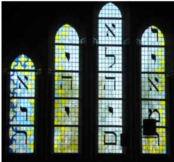
Jan Dibbets, Glas-in-lood ramen, 2014

Kunstenaar Jan Dibbets kreeg de opdracht om zestien nieuwe glas-in-loodramen te ontwerpen voor de Haarlemse basiliek Sint Bavo. Vanaf de oplevering van de kerk in 1898, door architect Pierre Cuypers, tot aan 1959 zijn er wel gebrandschilderde ramen geplaatst, maar door geldgebrek is dat niet bij het middenschip gebeurd. Nu er een grootscheepse restauratie aan de gang is wil de kerk dat alsnog. Het nieuwe ontwerp sluit aan bij de architectuur en de andere kunstvoorwerpen in de kerk, en verwijst naar bekende elementen uit het Rooms-Katholicisme en andere godsdiensten. Zo verwerkte Dibbets de vorm van een Latijns kruis, een Grieks kruis, een Patriarchenkruis en een Russisch-Orthodox kruis. Met een Hebreeuwse tekst verwijst hij naar het wrege lot van de Haarlemse joden die in de Tweede Wereldoorlog nabij de Sint Bavo werden samengebracht, alvorens op transport te worden gezet naar de Duitse concentratie- en vernietigingskampen.